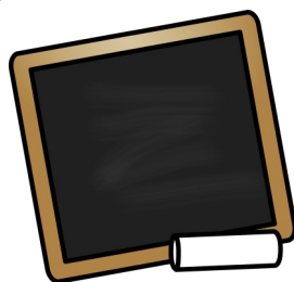
Kreide und Tafel