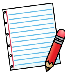
Papier und Stift