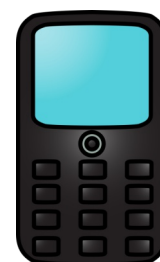
das Mobiltelefon das Handy