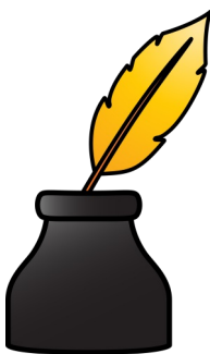
Feder und Tinte