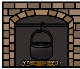
der Kamin das Feuer